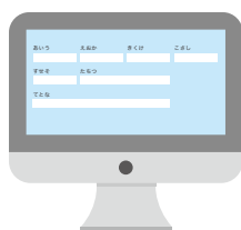
社内システムの 入力画面